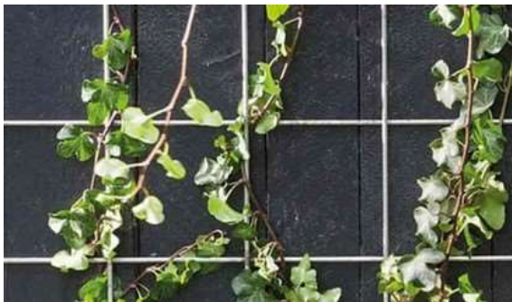
Voorbeeld van klimop aan een raster

Groene gevels bestaan in verschillende vormen. Het belangrijkste verschil is of de planten aan de gevel zelf groeien of aan een raster dat je aan de gevel hebt bevestigd. Daarnaast kan je ook planten bij je gevel zetten die niet tegen de gevel aan groeien. In dat geval spreken we van een geveltuintje.