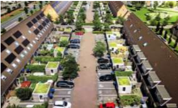
Voorbeeld van een straat met schuurtjes met een groen dak

Een groen dak vangt water op, biedt voedsel voor insecten en kan verkoelend werken in de zomer. Omdat je zorgt voor meer groen in je buurt draag je met planten op je dak ook bij aan een gezonde en aangename leefomgeving.