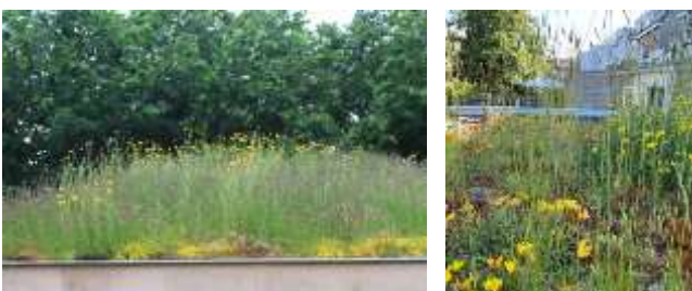
Voorbeeld van een vegetatiedak

Er zijn verschillende soorten groene daken. Een sedumdak komt bijvoorbeeld veel voor. Sedum is zeer geschikt als dakbegroeiing. Deze vetplant is licht van gewicht en kan goed tegen langdurige droogte én tegen een forse regenbui. Ook kruiden, bepaalde mossen en gras zijn goed bruikbaar op een groen dak.