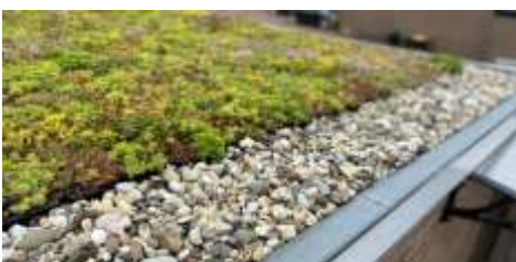
De rand van het dak wordt altijd voorzien met grind of tegels

Het is belangrijk om er zeker van te zijn dat het dak dat je wilt vergroenen, zoals dat van je schuurtje, geschikt is voor het gewicht van een groen dak. Daarom laten we dat eerst onderzoeken, als je je interesse kenbaar hebt gemaakt.