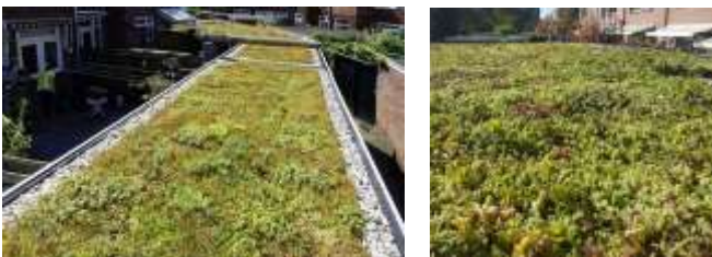
Voorbeeld van een sedumdak

Onderdeel van het project Klimaatadaptatie Zeeland is dat we in jouw wijk meerdere daken gratis (of tegen weinig kosten) van een groen dak mogen voorzien. Een mooie kans om meer groen toe te voegen aan je tuin en je straat!